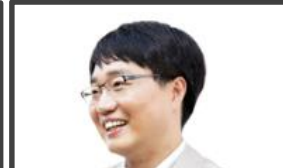
대한민국 최고의 육아멘토 ‘서천석 박사’