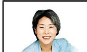
국내 최고 감정코칭 전문가 ‘최성애 박사’